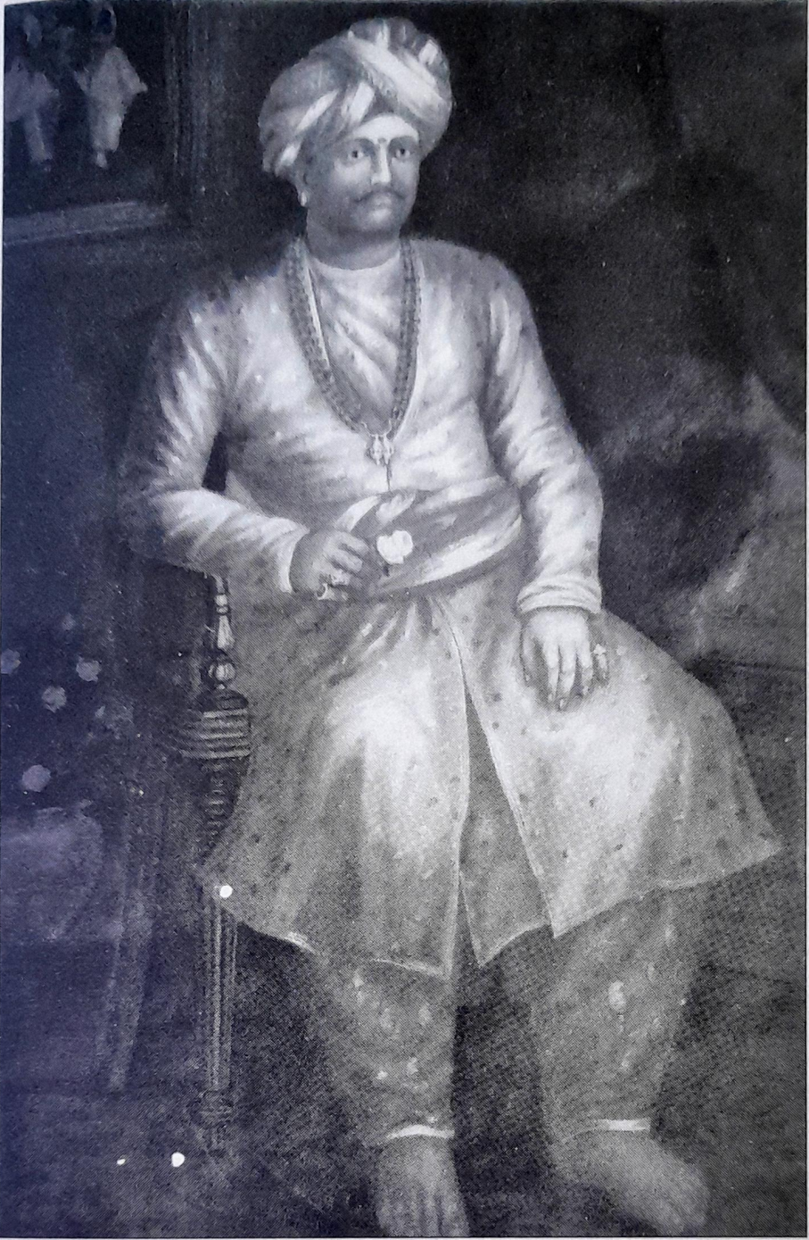
ಗುರಿಕಾರ್ ಶ್ರೀ ಮರಿಮಲ್ಲಪ್ಪ (1818-71)