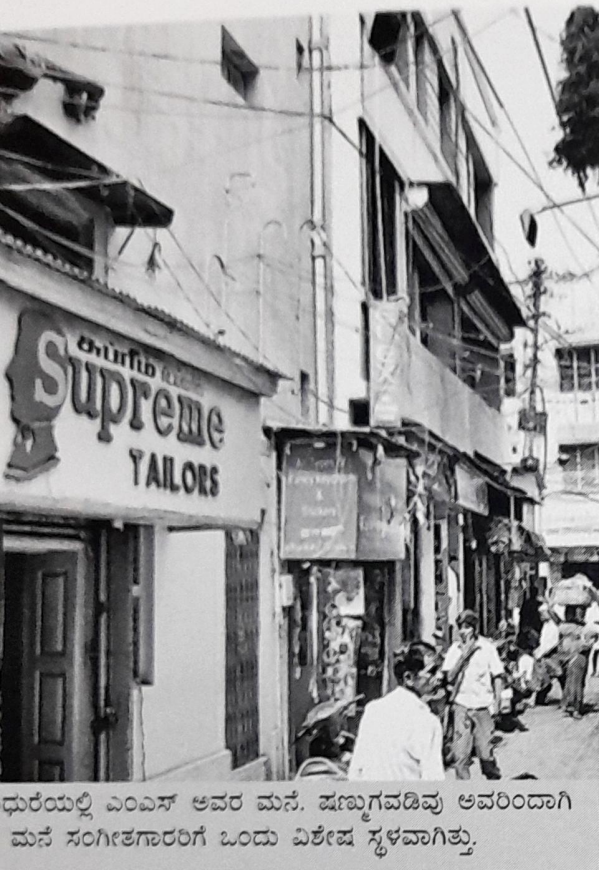
ಧರೆಯಲ್ಲಿ ಎಂಎಸ್ ಅವರ ಮನೆ. ಷಣ್ಮುಗವಡಿವು ಅವರಿಂದಾಗಿ ಮನೆ ಸಂಗೀತಗಾರರಿಗೆ ಒಂದು ವಿಶೇಷ ಸ್ಥಳವಾಗಿತ್ತು.

ವಸ್ಥಾನಕ್ಕೆ ತುಂಬಾ ಹತ್ತಿರದಲ್ಲೇ ಇತ್ತು. ಗಲೂ ಹಾಗೇ ಇದೆ! ಈಗಲೂ ಅದು ಷ್ಣೇ ಇಕ್ಕಟ್ಟಾದ ಧೂಳು ತುಂಬಿದ ಕೆ. ಅನೇಕ ವೇಳೆ ರಸ್ತೆ ತುಂಬಾ ಬರೀ ಸುಗಂಧ ಇರುತ್ತಿದ್ದವು. ಯಾರಿಗೂ ಜಾಗರಡೆ ರಸ್ತೆಯನ್ನು ಆಕ್ರಮಿಸಿಕೊಂಡು ಳ್ಚಿರುತ್ತಿದ್ದವು. ಕಾರು ಹೋಗುವುದಕ್ಕೂ ಳಗವೇ ಇರುತ್ತಿರಲಿಲ್ಲ. ಹಾರ್ನುಗಳ ಳ್ಚು, ಜನರ ಕಿರುಚಾಟ ಇವೆಲ್ಲಾ ತಮಗೆ ಳಿಸಿಯೇ ಇಲ್ಲವೆಂಬಂತೆ ಆರಾಮವಾಗಿ ಳುಕು ಹಾಕುತ್ತಾ ಮಲಗಿರುತ್ತಿದ್ದವು.