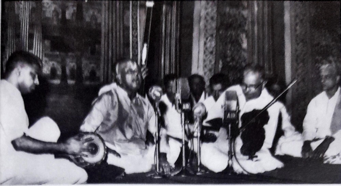
ಅರಿಯಾಕ್ಕುಡಿಯವರ ಸಂಗೀತವನ್ನು ಕೇಳುತ್ತಿರುವ ಜಿಎನ್‌ಬಿ

ಸಂಗತಿಗಳನ್ನು ಬಳಸಬೇಕೇ ಅಥವಾ ಒಂದು ಕ್ರಮವನ್ನು ಬಳಸಿ ನಿರೂಪಿಸಬೇಕೇ, ಎನ್ನುವುದರ ಬಗ್ಗೆ ಜಿಎನ್‌ಬಿಯವರು ಜನರ ಯೋಚನಾ ಕ್ರಮವನ್ನೇ ಬದಲಿಸಿಬಿಟ್ಟರು. ಆರೋಹ-ಅವರೋಹವನ್ನಿಟ್ಟುಕೊಂಡು ಕ್ರಮಬದ್ಧವಾಗಿ, ಹಂತಹಂತವಾಗಿ, ಸ್ವರಸ್ಥಾನಗಳನ್ನು ಆಧರಿಸಿ ರಾಗವನ್ನು ವ್ಯವಸ್ಥಿತವಾಗಿ ಬೆಳೆಸುವ ಕಡೆಗೆ ಜನರ ಆಲೋಚನೆಯನ್ನು ಹೊರಳಿಸಿದರು. ಈ ಮೂಲಕ ರಾಗವನ್ನು ಗ್ರಹಿಸುವ ಕ್ರಮದಲ್ಲೇ ಒಂದು ಪಲ್ಲಟವನ್ನುಂಟುಮಾಡಿದರು. ಅವರು ಬೇರೆ ಬೇರೆ ರಾಗಗಳನ್ನು ನಿರ್ವಹಿಸುತ್ತಿದ್ದ ರೀತಿಯಲ್ಲಿ ಇದು ವ್ಯಕ್ತವಾಗುತ್ತಿತ್ತು. ಹೀಗಾಗಿಯೇ ರಾಗದ ಒಟ್ಟು ಬಂಧಕ್ಕೆ ಹೊಂದಿಕೊಳ್ಳದ ಸಂಗತಿಗಳನ್ನು ಅವರು ಬಿಟ್ಟೇ ಬಿಡುತ್ತಿದ್ದರು. ಕೃತಿಗಳಲ್ಲೂ ಒಂದಿಷ್ಟು ಬದಲಾವಣೆಗಳನ್ನು ಮಾಡಿಕೊಳ್ಳುತ್ತಿದ್ದರು, ಆನಂದಭೈರವಿಯ ಮರಿವೇರೆ ಕೃತಿಯಲ್ಲಿ ಸ್ವರಸಾಹಿತ್ಯವನ್ನು ಹಾಡುವಾಗ ಅವರು "ಪದಪಮಗಾ" ಎಂದು ಹಾಡುವುದಕ್ಕೆ ಬದಲಾಗಿ "ಪನಿಪಮಗಾ" ಎಂದು ಹಾಡುತ್ತಿದ್ದರು. ಏಕೆಂದರೆ ಅಲ್ಲಿ ದೈವತವು ನಿಷಾದದ ಸ್ಥಾನದಲ್ಲಿ ನುಡಿಯುತ್ತದೆ. ಹಾಗಾಗಿ ಅವರ ಪ್ರಕಾರ ಇಲ್ಲಿ ದೈವತಕ್ಕೆ ಬದಲು